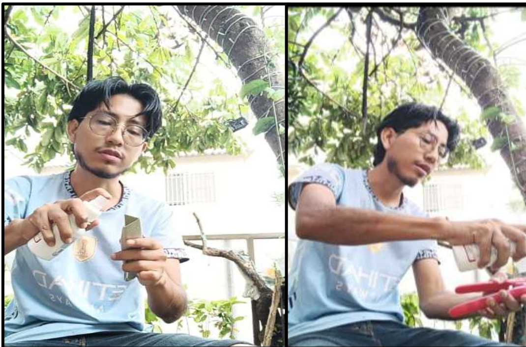
Figura 11. Preparación de materiales para injertar.