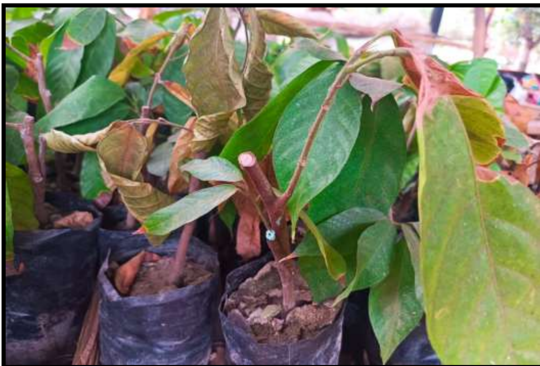
Figura 21 Injertos a los 60 días.