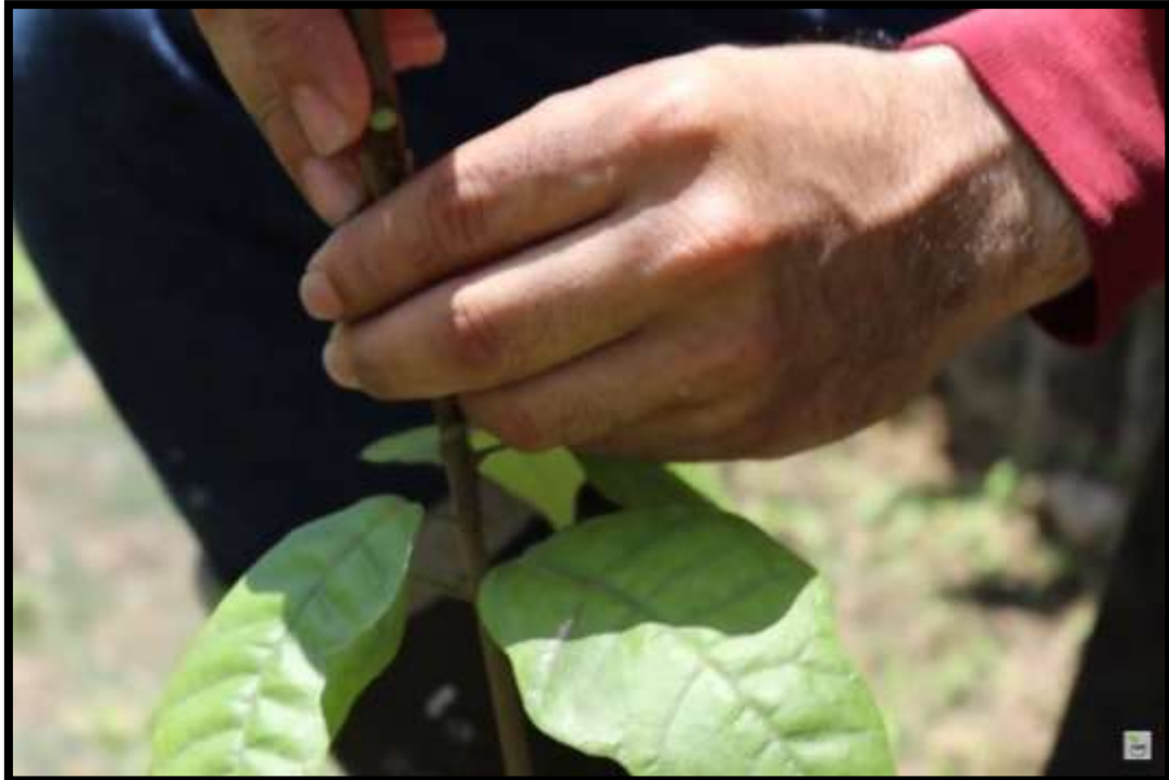
Figura 3. Técnica de injerto púa terminal