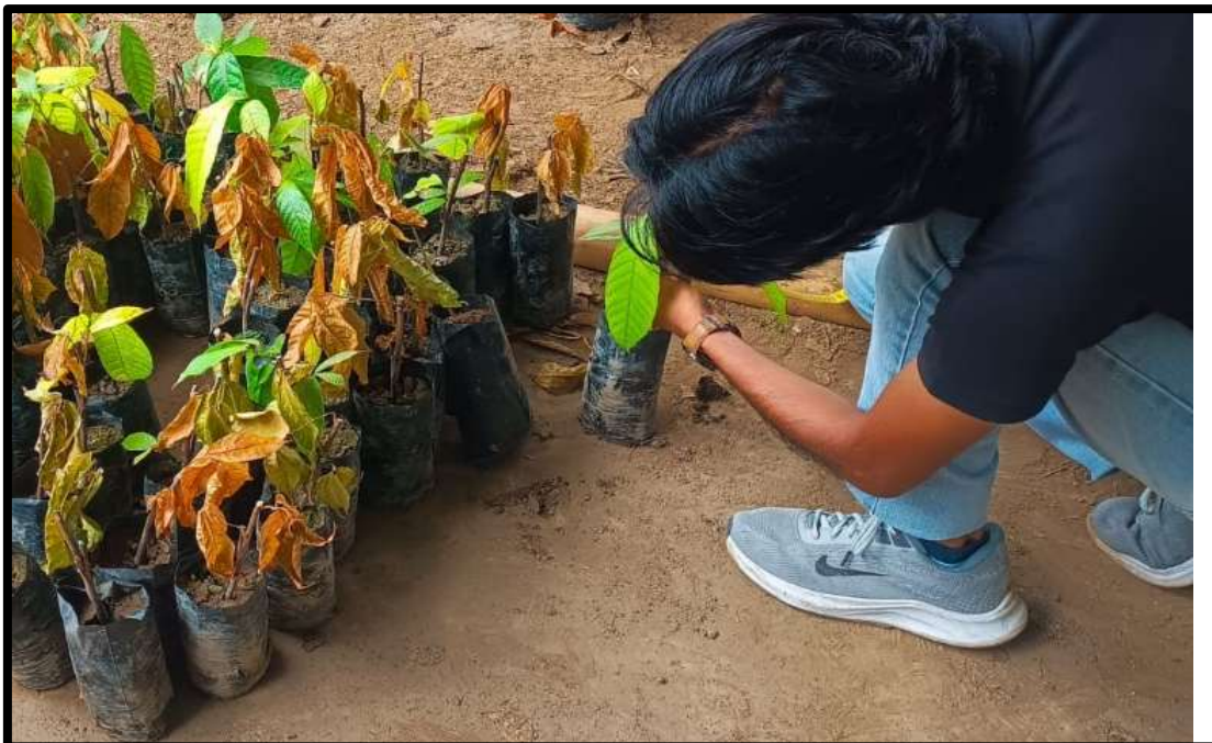
Figura 17 Evaluación de la altura del injerto.