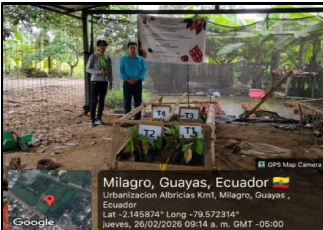
Figura 22 Revisión y finalización del proyecto de tesis.