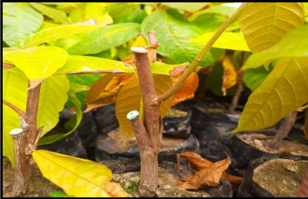
Figura 15. Injerto prendido exitosamente.