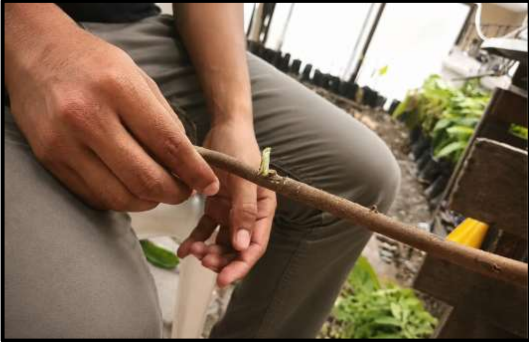
Figura 13 Realización técnica de parche.