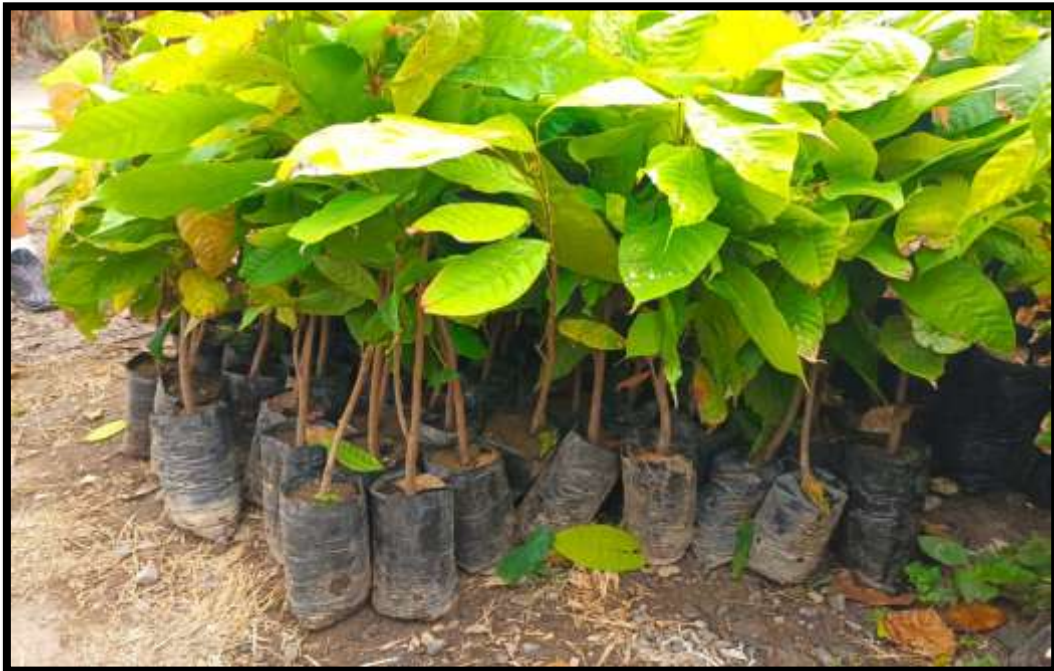
Figura 14. Plantas patrones seleccionados para injertación.