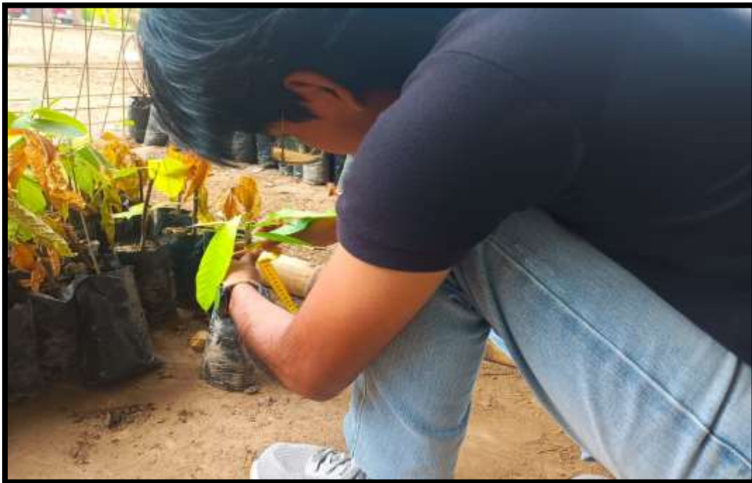
Figura 16. Evaluación del diámetro del injerto a los 30 días.