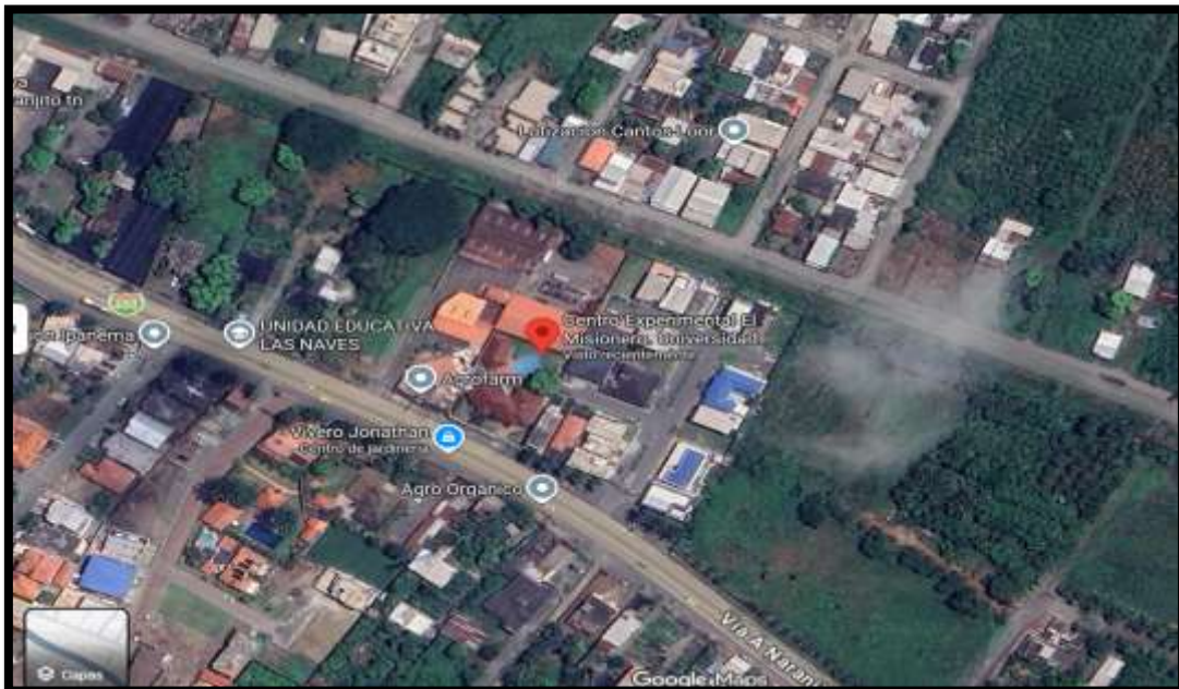
Figura 2. Georreferenciación del área de trabajo