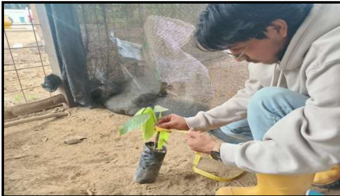
Figura 18 Evaluación del diámetro del injerto a los 60 días.