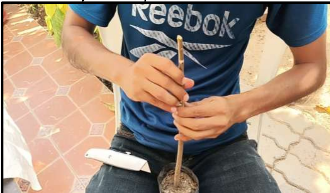
Figura 12. Realización de injerto técnica púa.