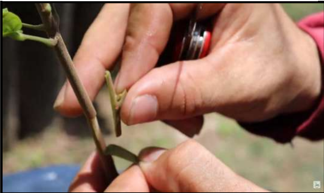
Figura 4. Técnica de injerto (parche)